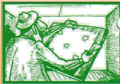
5. Nanesieme bodovo lepidlo na polystyrénovú kazetu