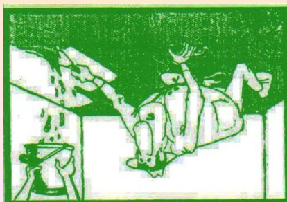
2. Odstránime starý náter