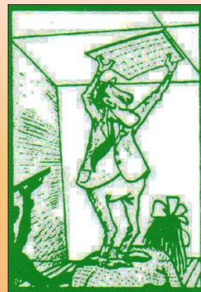
6. Nalepíme stropnú dosku k stredu miestnosti