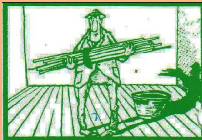
8. Pripravíme si polystyrénové lišty