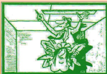
4. Nakreslíme kolmice cez stred miestnosti