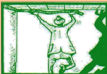
10. Prilepíme stropnú lištu na stenu