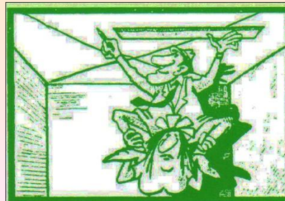
3. Nájdem stred miestnosti